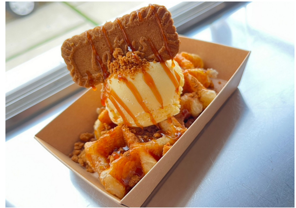
『ロータス』アイスクリームおトッピング