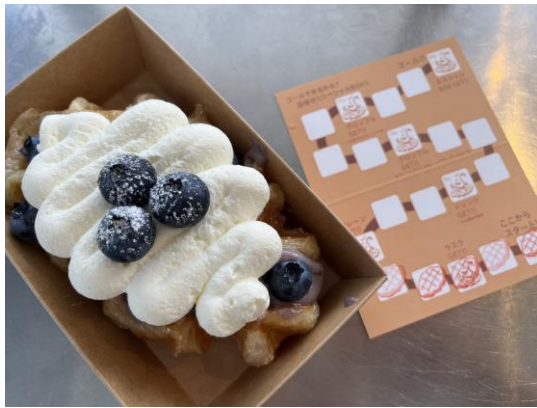
ブルーベリークロッフルとポイントカード

千葉県松戸市の住宅街にてクロッフル専門店を展開する「Sunshine Croffle（サンシャインクロッフル）」は、2025 年 6 月 4 日（水）に開業 2 周年を迎えました。これを記念し、日頃から応援いただいているお客様への感謝を込めて、最大 3,500 円相当の特典付き「ポイントカード」を、数量限定で配布いたします。